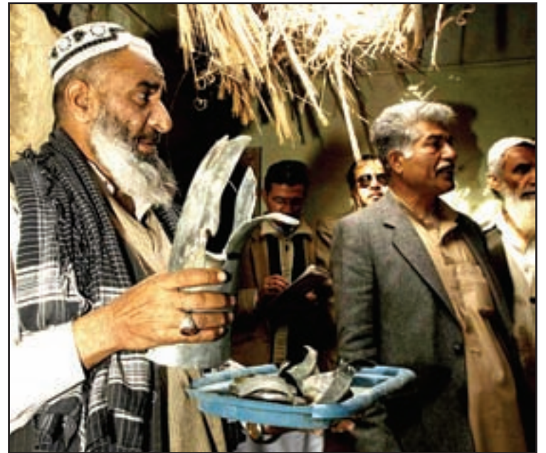
Un habitante di un pueblo ta muestra resto di un raket cu a wordo tira pa e tribo rabia di Mach, mas omenos 60km di Quetta, capital di e provincia Balochistan.